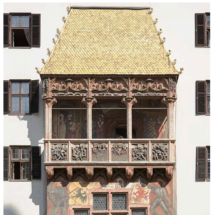
Das Goldene Dachl in Innsbruck