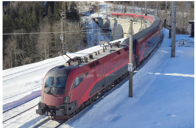
der Railjet -Schneelandschaft.

Erste Siedlungsspuren wurden in spätrömischer Zeit einige km nördlich des heutigen Stadtgebiets der Stadt Feldkirch entdeckt. Bereits im Jahr 1218 wurde Feldkirch erstmals urkundlich als Stadt erwähnt. Beim Besuch ist man ob der sehr gut erhaltenen Altstadt mit mittelalterlichem Flair erstaunt - die auf dem Bergvorsprung thronende Schattenburg (erster Baubeginn unter Hugo I. von Montfort um das Jahr 1230) erweist sich als Blickfang. Die Stadt beruht auf einem geometrischen Rastersystem und seit der Errichtung der Stadtmauer um das Jahr 1500 wurde dieses Bild nicht verändert.