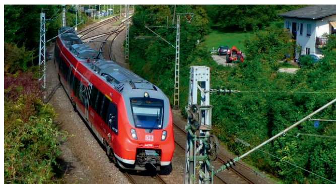
Bahn bei Wincheringen

Es sollte jedoch erwähnt werden, dass die Züge auf der Bahnstrecke, welche während der Annexion von Lothringen-Elsass dem deutschem Fahrbetrieb unterworfen war, auf der rechten Seite fahren – bei der Fahrt ab dem Hbf Trier hat man somit die Mosel stets im Blick. Leider wurde der grenzüberschreitende Bahnverkehr zum Leidwesen der Pendler eingestellt. Die beiden Bahnhöfe Apach und Perl sind somit Endbahnhöfe. Tagsüber pendeln die Triebwagen im Stundenrhythmus zwischen Trier und Perl. Die maximale Geschwindigkeit wird mit 120 km/h angegeben. Ab Dezember 2013 wurde dann der Bahnverkehr zwischen Apach und Thionville eingestellt und der Busdienst übernahm diesen Dienst.